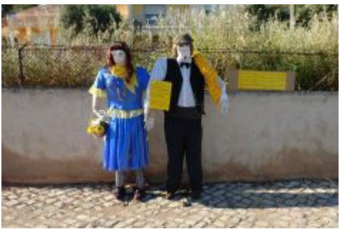
MAIOS 2014 Santa Catarina da Fonte do Bispo e Umbria